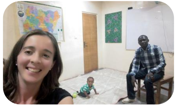
Lucky's nieuwe kantoor

Ik ben volop bezig met het oriëntatieproces en ben aangemeld om deel te nemen aan een belangrijke workshop (participatiemethoden voor betrokken gemeenschappen) van 18 tot 29 juni 2018. Dit helpt me hopelijk bij de voorbereidingen voor het opstarten van mijn werk. Ik heb twee keer gereisd in verband met de projecten. Eén keer met mijn supervisor en andere collega's om de mensen van de taalgroep te ontmoeten, kennis te maken met hun werkwijze en om contact te leggen met de eerstverantwoordelijken voor de taalgroep.